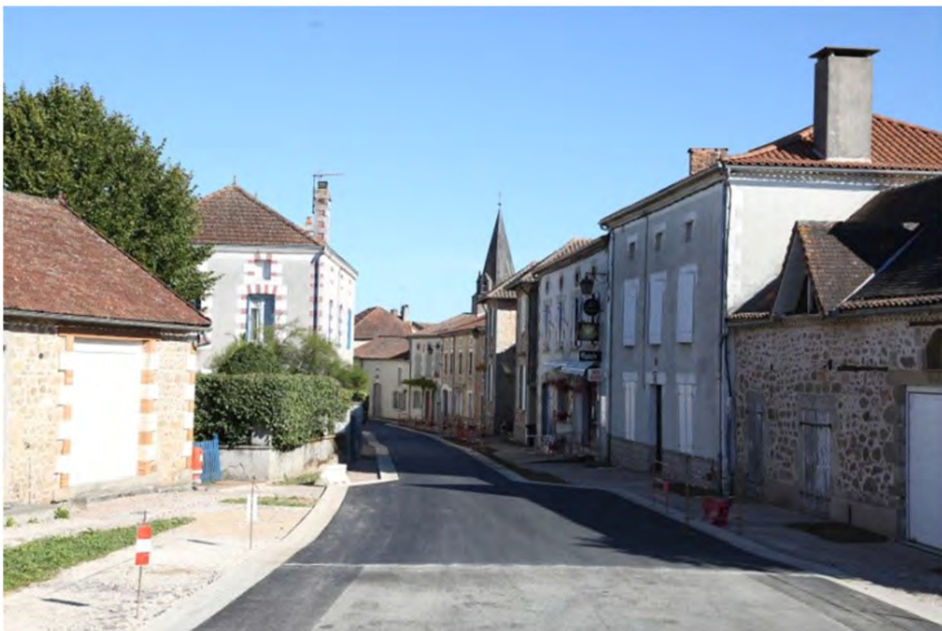
Vue du Bourg, route bitumée juillet 2020