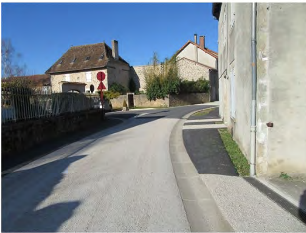
Les trottoirs sont bitumés et du revêtement « Meteor » est harmonieusement réparti sur la route et certains accès