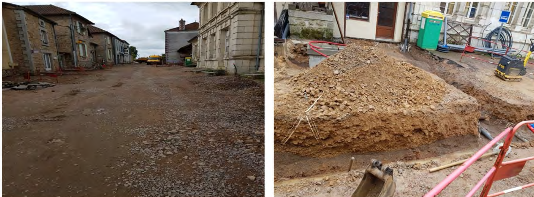
Vues du chantier février 2020

La Commune d'Abjat sur Bandiat a terminé la première phase de son grand projet de fleurissement à savoir le reprofilage de la traversée du Bourg. La route principale a été rapidement goudronnée grâce à l'appui du Conseil Départemental de la Dordogne qui finance ce projet de voirie à hauteur de 50 %. Les travaux, réalisés par l'entreprise locale Bonnefond se sont déroulés avec succès et nous les félicitons. Demain, débutera la deuxième phase du projet avec le fleurissement à proprement dit de la commune, sur des espaces harmonieusement répartis sur les trottoirs et les accotements à partir du rond-point situé au niveau de la place des Marronniers jusqu'à l'Église St André et la Place du Temps Jadis. Cette opération d'embellissement de la Commune se fera avec la participation des volontaires passionnés abjacoises et abjacois réunis dans un groupe de travail qui a d'ores et déjà commencé ses réflexions. La troisième phase concernera la création du Jardin des Légendes, avec des animations autour de la « Légende de la Belle de Fargeas » qui permettra de donner un atout touristique supplémentaire à une commune décidée à mettre tout en œuvre, avec son équipe municipale recomposée, pour dynamiser son indéniable potentiel.