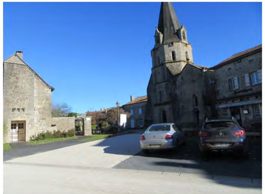
Novembre 2020 - Le parking est tracé devant l'Église St André.