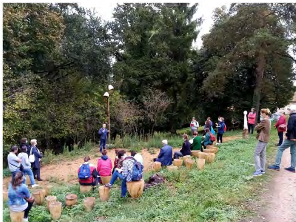
Petit amphithéâtre en plein air

Ici débute une promenade à travers un espace boisé, jalonné de stations dédiées tantôt aux traditions locales, avec une représentation stylisée de la feuillardière, tantôt à la Légende d'Abjat proprement dite, avec le serpent, sculpté par Rudy BECUWE, et plus loin encore, un espace circulaire entouré de bois enstéré destiné, par exemple, à des ateliers artistiques pour les écoles.