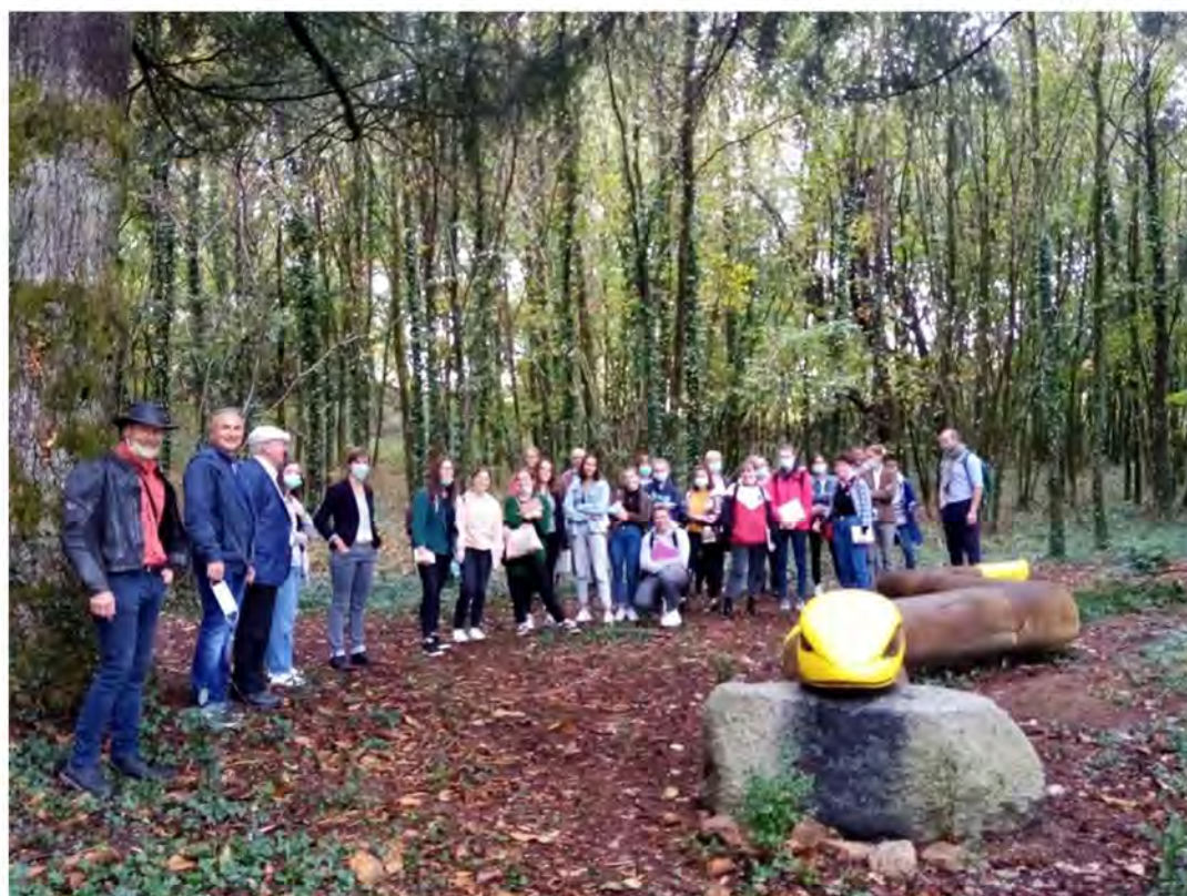
Le Serpent de la Légende