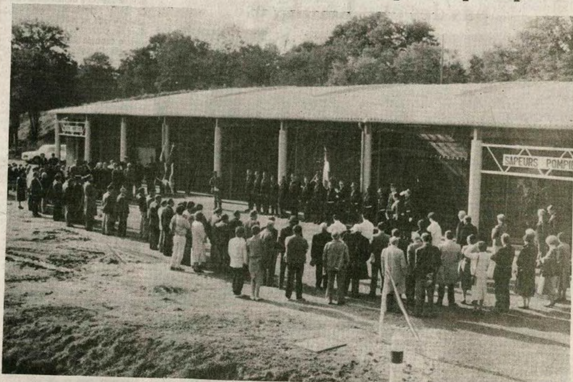
Samedi dernier, les pompiers